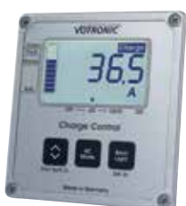
Art-Nr. 1247 LCD-Charge Control S